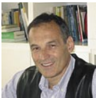
di Ermenegildo Arnoldi Oncologia, Riuniti Responsabile del “Progetto onco-geriatrico GONG”

Oncologia e medicina interna dei Riuniti studiano assieme i migliori modelli assistenziali per individualizzare i trattamenti e aumentare la qualità delle terapie. A novembre un convegno per comunicare i risultati.