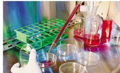
Tumori del sangue: nuovi modelli di cura grazie allo studio From

hanno partecipato medici bergamaschi con alta competenza nel settore dell'ematologia, hanno aderito anche ricercatori europei ed è stato costituito un network di centri che hanno inviato la storia dei loro pazienti ai laboratori di biostatistica della From.