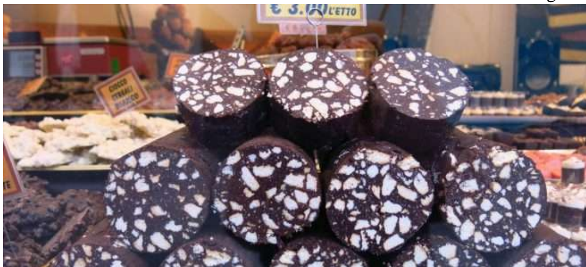
Fiume di cioccolato sul Sentierone e tagliatelle al cacao dalla Giuliana